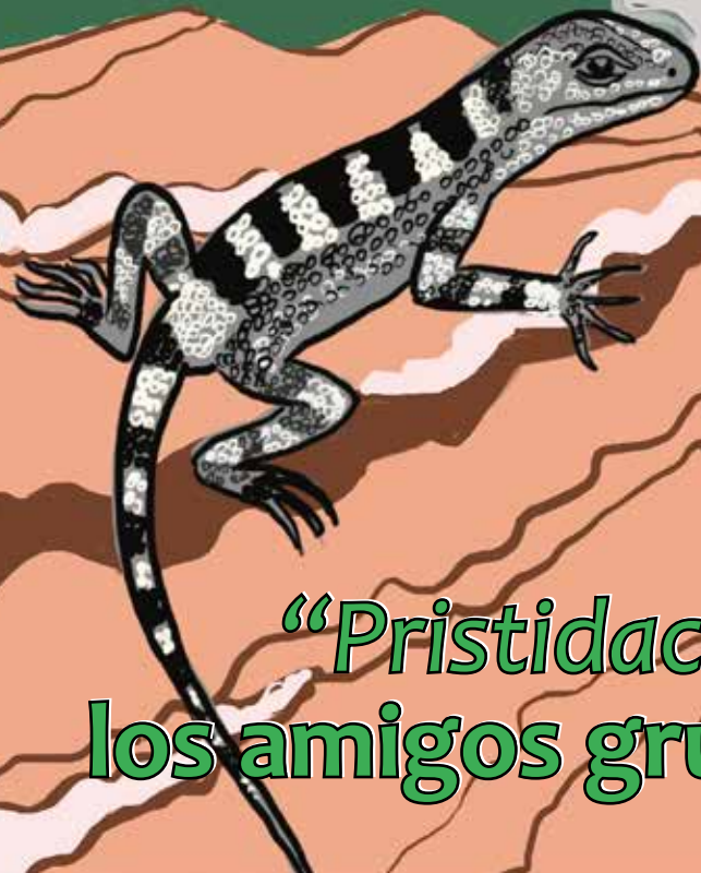
Ilustración: Carlos Balló